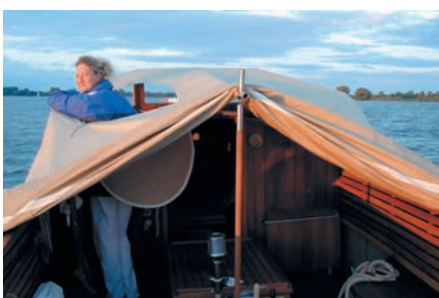
Persenning, falls Schlechtwetter droht