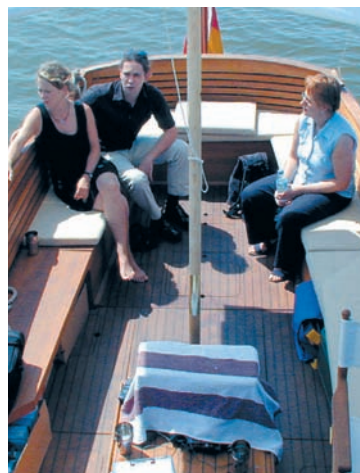
Plicht: Platz für bis zu 12 Personen