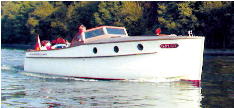
Das besondere Erlebnis: Dahingleiten auf Berliner Gewässern

Engelbrecht-Backdeckkreuzer Orlov: Klassiker anno 1928