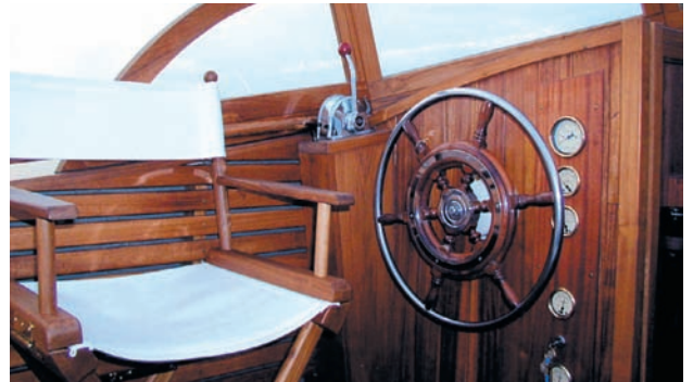
Klassik pur: Der Steuerstand

Der Backdecker ORLOV wurde 1928 gebaut und in den Jahren 2000 und 2001 in liebevoller, aufwendiger Detailarbeit restauriert. Dabei wurde hoher Wert auf klassische Echtheit bezüglich der Materialien und Zubehörteile gelegt.