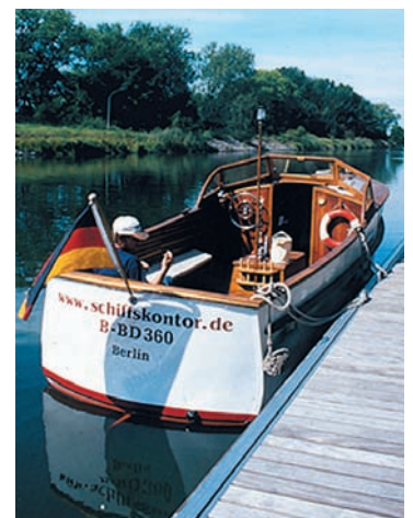
Idyllische Ruhe auf der Havel