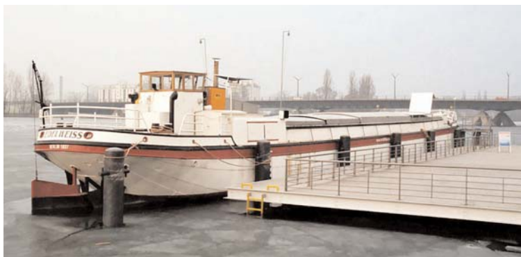
Liegeplatz mit fester Steganlage Haveleck Spandau