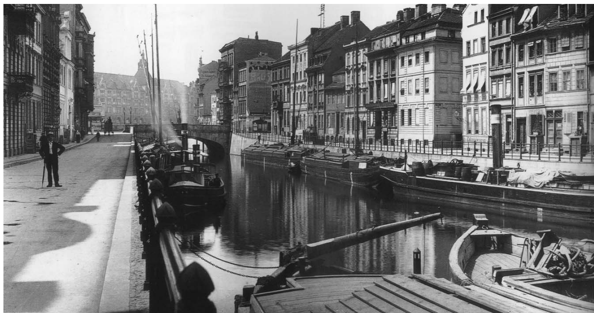
Impressionen anno 1874 – Kupfergraben, Mühlendamm Schleuse

Einer der letzten noch fahrtüchtigen Finowmaßkähne