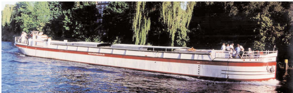
EDELWEISS während einer der Überführungsfahrten