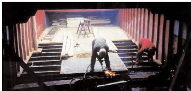
Der alte Frachtraum