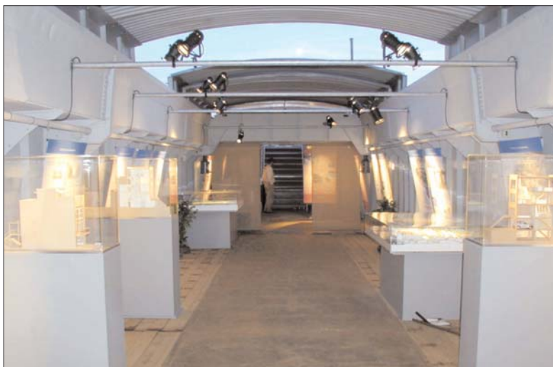
140 m² schwimmende Ausstellungsfläche