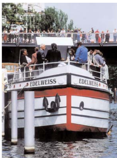
Eröffnung im Mai 2001