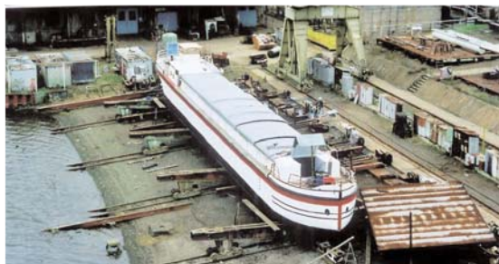
Umbau in Eisenhüttenstadt, Winter 2000/2001