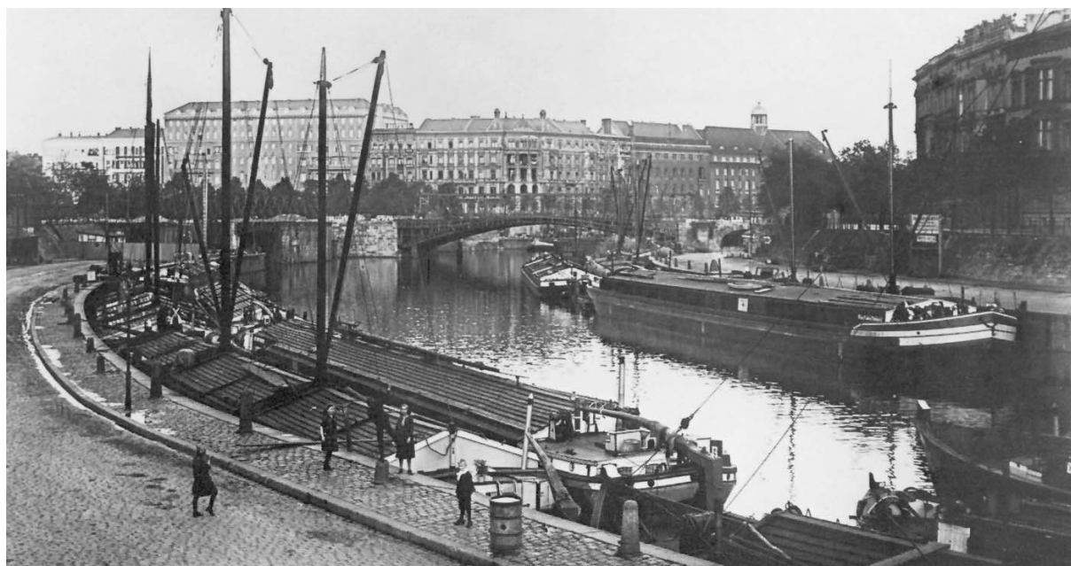
Spreebogen, Mitte anno 1898