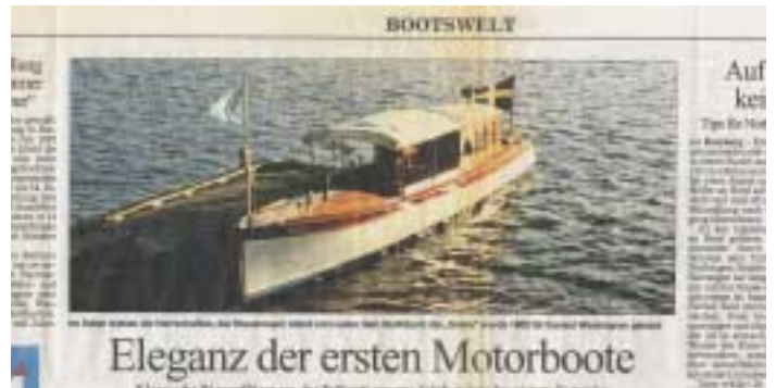
Zeitungsartikel aus „Die Welt“ von 1996

Das hoch elegante Salonboot aus einem schwedischen Werftbau (Baujahr 1908, nach anderen Angaben bereits 1905) wurde als so genannte „Salonslup“ entworfen und gebaut. Als Material kamen Eichenholz und Mahagoni zum Einsatz. Noch heute ist der Zustand des kleinen, für 2 bis 8 Personen gedachten Schiffs sehr gut.