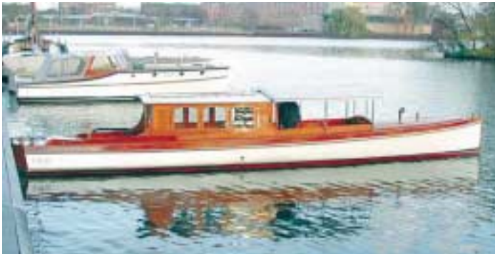
Lang und schmal liegt das elegante Salonboot im Wasser

Elegante Perle fürs Hotel: „Salvia“ Bj. 1908, Schweden