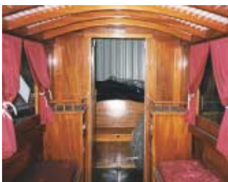
Der Salon in rotem Samt